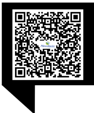
Trasa Rajdu MTB